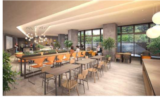
〈ロビー・ラウンジ(朝食会場)〉

エントランスは来街者を取り込めるような開放的な空間を演出し、テラス席の設置などで賑わいづくりを行います。